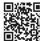
ABB Contact Center tel. 22 223 77 77 https://stories.abb.com/automatyka-domowa kontakt@pl.abb.com